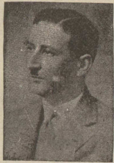
Arnavutluk kralı Zoğ Türkiye ile görüşülecektir. Londra 11 A A. (Radyodan)

Kanton deltası içinde 31 martta boşaltılmış olan Kongnin şehri Çinliler tarafından geri alınmıştır.